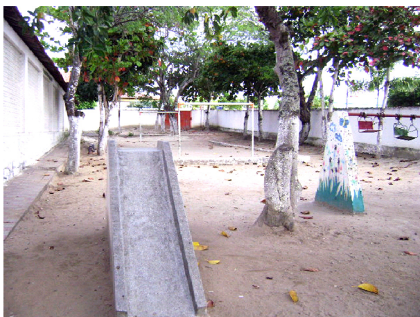
Imagem 01: Playground: novas possibilidades lúdicas

Outra alternativa para a arrecadação de fundos para a escola, é a organização de bingos. Com o dinheiro arrecadado em um deles foi construído o playground, que trouxe novas possibilidades lúdicas para as crianças, como podemos observar na foto a seguir.